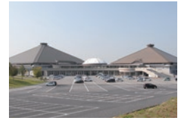
岡崎中央総合公園