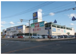
コムタウン岡崎 国道248号沿いの乙川のほとりに位置する「コムタウン」の愛称で岡崎市民に親しまれている郊外型商業施設。