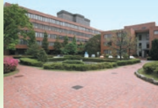
総合研究大学院大学 物理科学研究科 ・構造分子科学専攻・機能分子科学専攻 分子科学研究所 明大寺キャンパス

イオンモール岡崎 10スクリーンのシネマコンプレックス、4,300台収容の駐車場を有する巨大ショッピングモール。