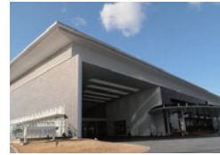
岡崎市図書館交流プラザ 様々な市民活動などを支援する図書館を核とする生涯学習複合型施設。愛称はLibra(りぶら)。