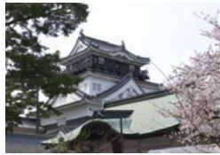
岡崎公園 岡崎城の城跡を公園にしたもので、桜の名所としても知られる岡崎市を代表する歴史と文化の公園です。